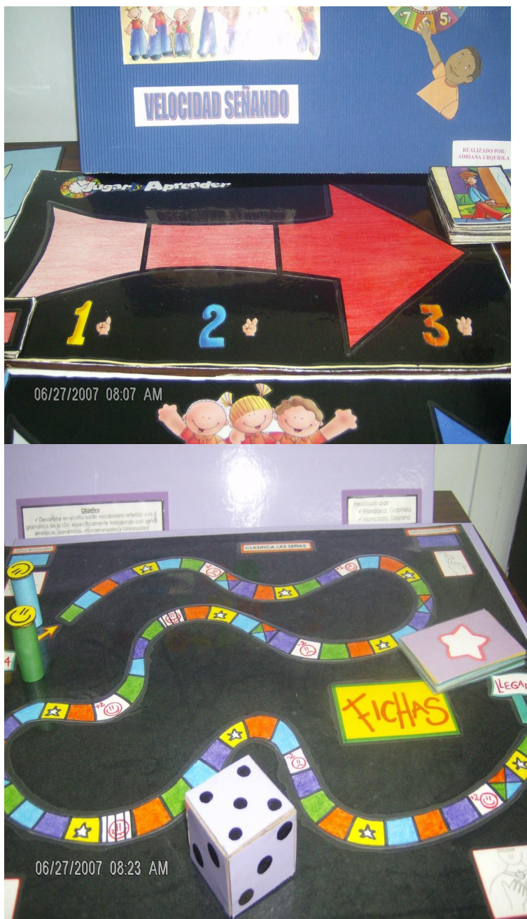
Ilustración N° 3 Juegos para el desarrollo de la imaginación