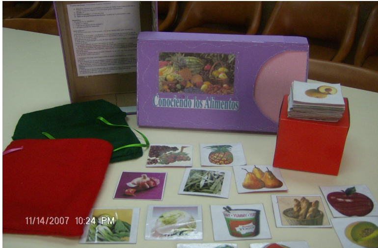
Ilustración N° 2 Juegos para el conocimiento gramatical de la LSV