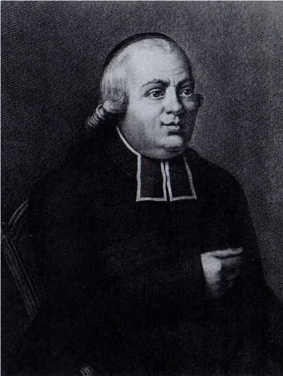
Retrato del abad de L'Épée,

Louis XVI, finalmente, le cedió la propiedad de un antiguo convento para que tuviera mas espacio