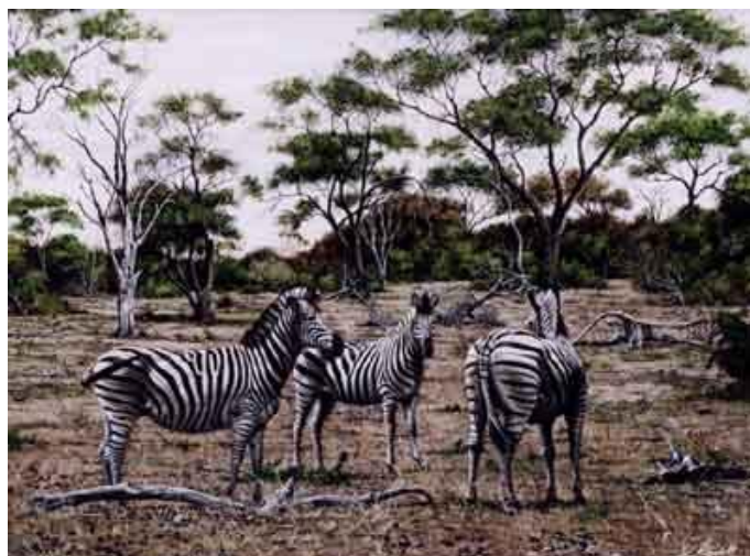
Cebra en Satara África