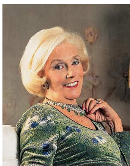
Amalia Lacroze de Fortabat

Amalia Lacroze abrió en 2008, en el distinguido barrio porteño de Puerto Madero, en la Ciudad de Buenos Aires, un museo que lleva su nombre en donde expone su colección de cuadros y esculturas de Bellas Artes. Allí pueden observarse obras de grandes artistas plásticos, entre ellos algunas de Jorge Rajadell.