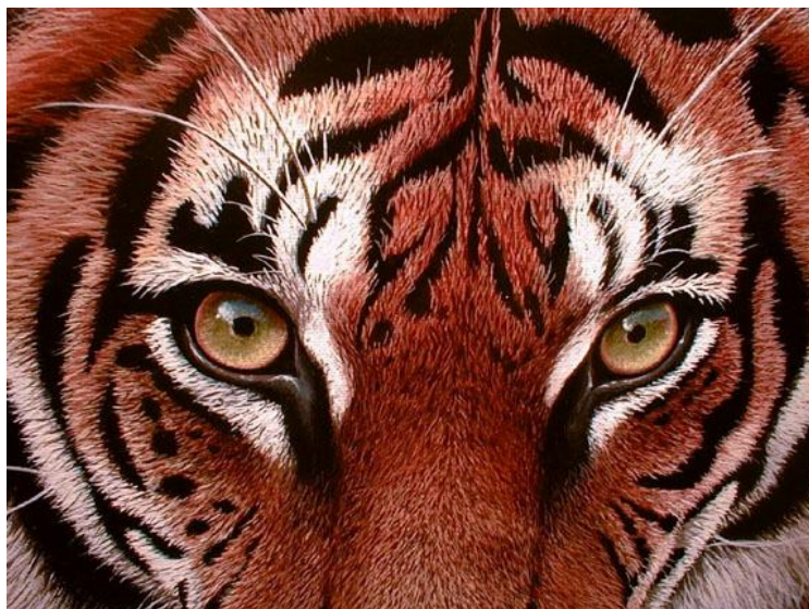
Tigre óleo en tela