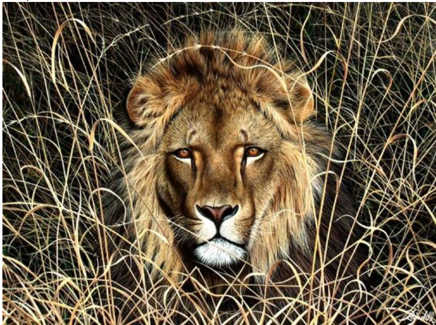
Acechando - pintura con técnica acrílica en tela estilo hiperrealismo 2002-

“El artista borra los límites entre sus pinturas y la realidad de lo que ve. Un ejemplo es el cuadro León en Letaba. ... Rajadell es uno de los principales artistas hiperrealistas del país”. (Revista Viva - Diario Clarín - Diego Bagnera - 24/01/1999).