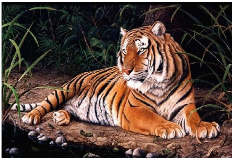
Tigre en los juncos

"Con talento y con un perfeccionismo extremo, Rajadell hizo su trabajo milimétrico. Tanto, que es difícil resistir el impulso de tocar la tela para comprobar que no tiene la suavidad de un pelaje". Claudia Dubkin - Revista SOMOS - año 1993/26/07.