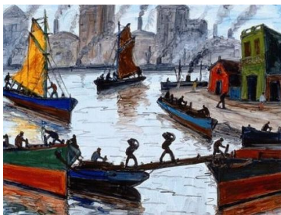
Obra de Quinquela Martín