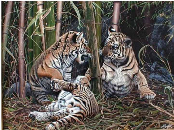
Jugando en las cañas - Óleo sobre tela

“El artista borra los límites entre sus pinturas y la realidad de lo que ve. Un ejemplo es el cuadro León en Letaba. ... Rajadell es uno de los principales artistas hiperrealistas del país”. (Revista Viva - Diario Clarín - Diego Bagnera - 24/01/1999).