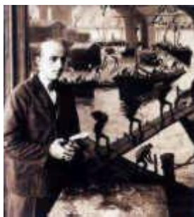
Benito Quinquela Martín (Buenos Aires 1890 - 1977)