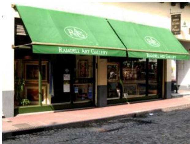
Rajadell Art Gallery