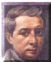
Autorretrato Delesio Antonio Berni Rosario Santa Fe Argentina 1905/1981