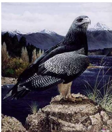
Águila Mora en Neuquén (Argentina)

“Lo que busco en cada una de mis pinturas es reproducir lo que el ojo humano ve. Exactamente, de la misma manera, sin ninguna distorsión”, destaca Jorge y agrega - “Poder pintar unos limones y que a la gente le provoque las ganas de tomar uno, eso es lo que busco. Es una competencia que tengo conmigo mismo”.