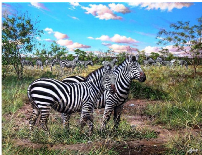
Cebra en el amanecer - acrílico sobre tela