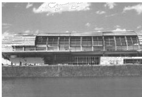
Museo Amalia Lacroze de Fortabat

En septiembre de 1992 Jorge casi duplicó la oferta, ya que otra de sus obras “El Yaguar” se cotizó en cuarenta y cuatro mil dólares.